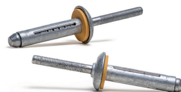
Ø 7,8 S-trebol WP

The total or partial reproduction of this document is prohibited. The figures showed in this catalogue are typical values and they could be changed as a result of the continuous improvement of products. Please, do not hesitate to contact us if you need an updated information. Queda prohibida la reproducción total o parcial de este documento. Los datos que aparecen en este catálogo son valores típicos y están sujetos a modificaciones como consecuencia de la mejora continua de los productos. Consúltenos si necesita información actualizada.